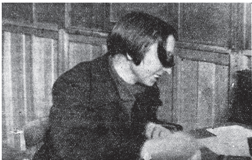
Lucía Sánchez Saornil, de la Redacción de "C. N. T."