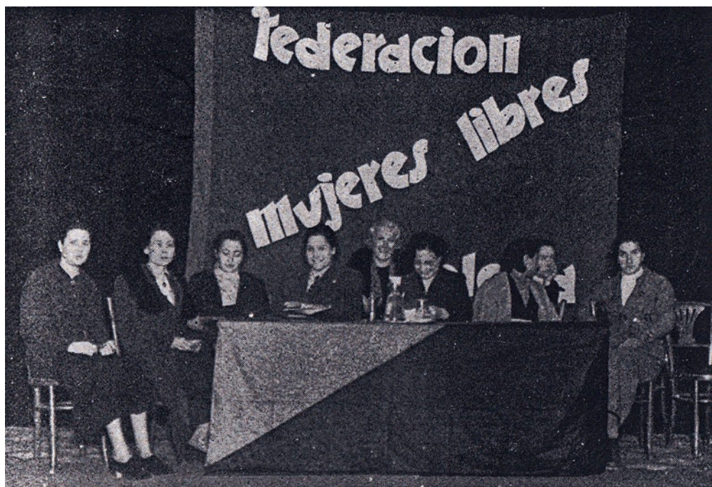
Acto de la Federación de Mujeres Libres.